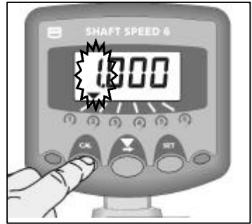
Fig 5: Afficher le Facteur de Cal.