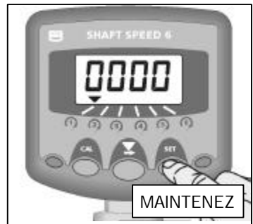
Fig 2: Afficher la Vitesse d'Alarme