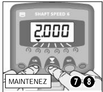
Fig 6: Régler le Facteur de Cal.