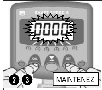
Fig 4: Activer/Désactiver l'Alarme