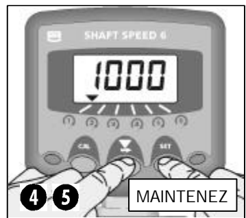
Fig 3: Régler la Vitesse d'Alarme